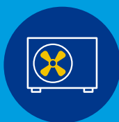
Pompe à chaleur Air/Eau

Sonepar et son partenaire ENGIE Home Services vous permettent d' élargir votre champ d'activité grâce à des solutions clés en main de mise en service et de maintenance de produits avec fluides frigorigènes : PAC, Ballon thermodynamique, chauffe-eau, chaudière... Votre équipement est mis en service et entretenu par votre expert !