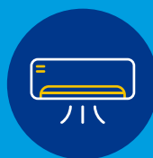
Pompe à chaleur Air/Air